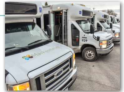
Les Studios François Larivière