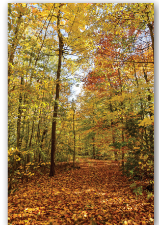
Les Studios François Lavoie

Il y a, à Saint-Dominique, un magnifique parc naturel qui vaut le détour pour l'intérêt de sa topographie, sa couverture végétale et sa géomorphologie. Des activités de plein air y sont offertes en toutes saisons telles que la randonnée pédestre, le vélo, le ski de fond et la raquette. Le site, administré par un organisme à but non lucratif, est situé en face des Pavages Maska (767, Principale). Visitez leur page Facebook (sous le nom de Boisé de la Crête Saint-Dominique) pour plus de détails.