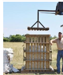
À l'aide d'un presseoir