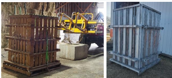
Avec l'utilisation d'un bloc de béton