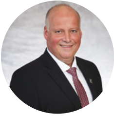
MONSIEUR SIMON GIARD Préfet de la MRC des Maskoutains Maire de Saint-Simon