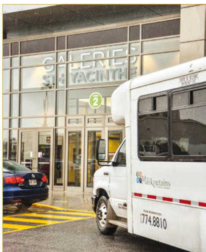
Les Studios François Larivière | © MRC des Maskoutains