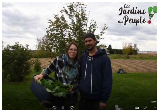
Extrait vidéo de la MRC pour L'ARTERRE